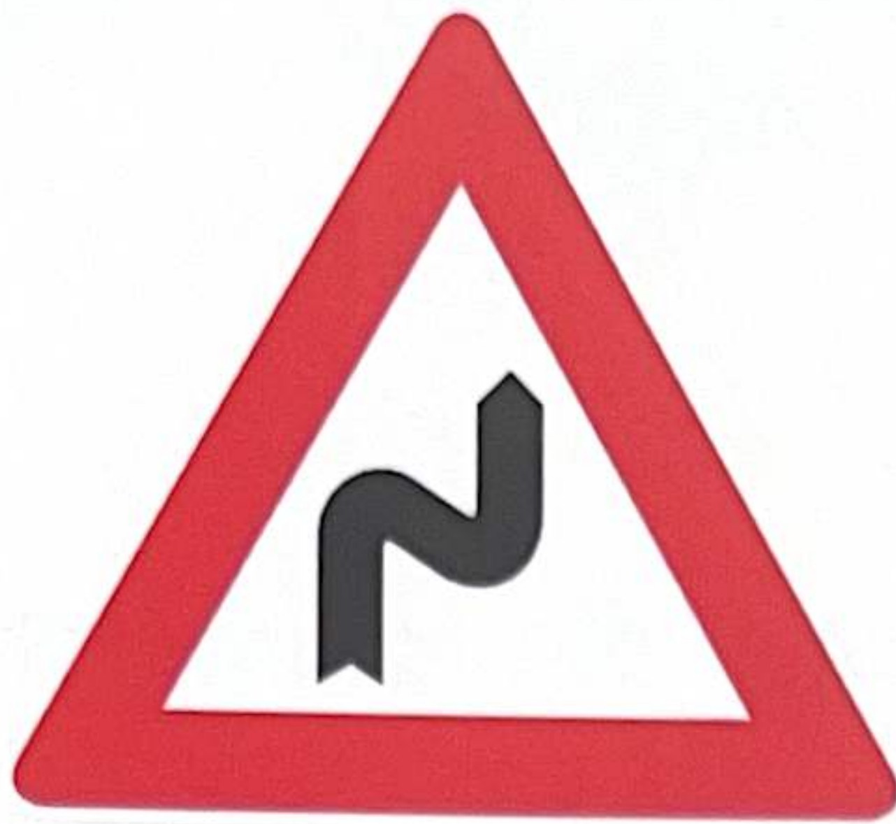
DOUBLE COURBE, LA PREMIÈRE À DROITE