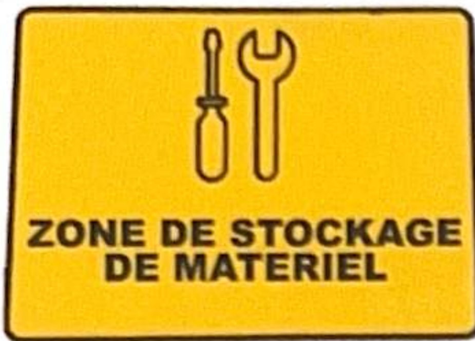
ZONE DE STOCKAGE DE MATERIEL