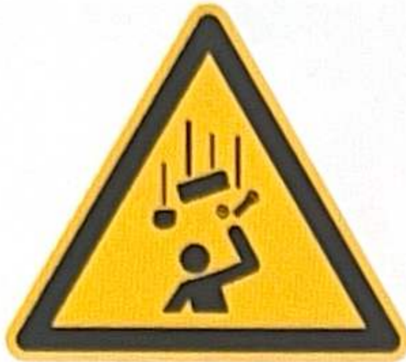
RISQUE DE CHUTE D'OBJET