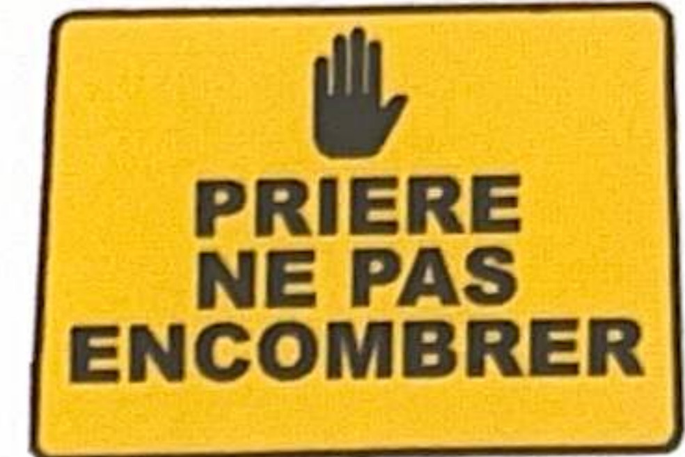
PRIERE NE PAS ENCOMBRER