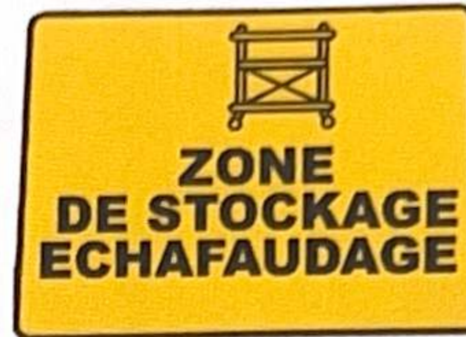
ZONE DE STOCKAGE ECHAFAUDAGE