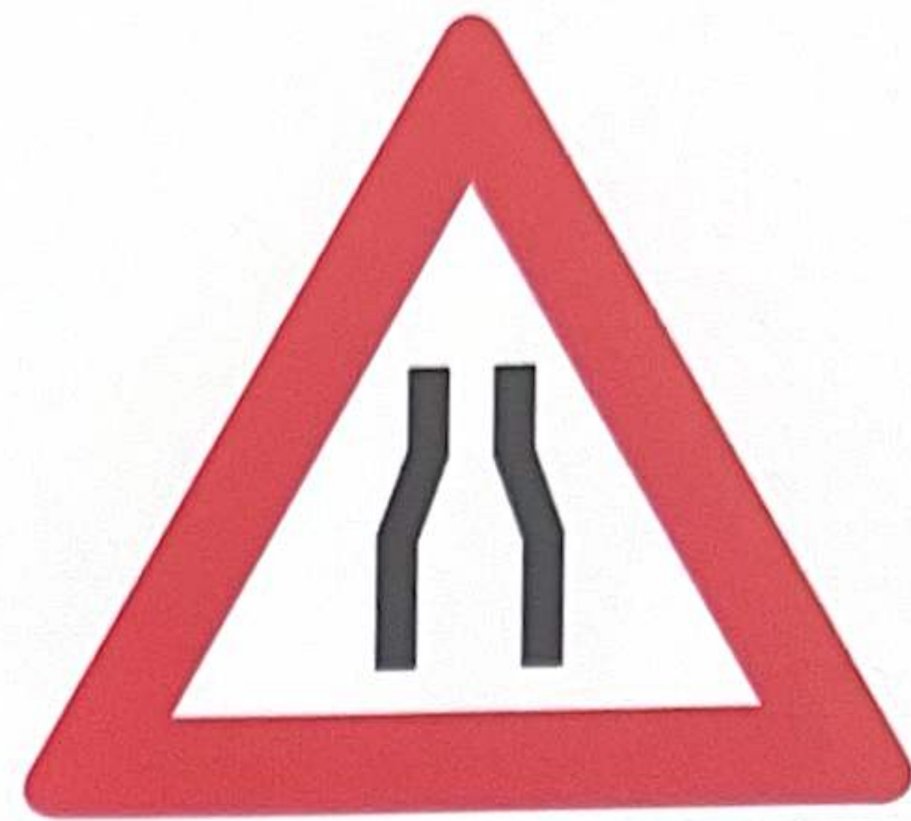
GOULOT D'ÉTRANGLEMENT SYMÉTRIQUE