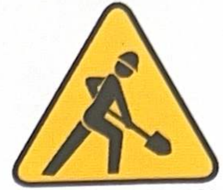
ATTENTION TRAVAUX EN COURS