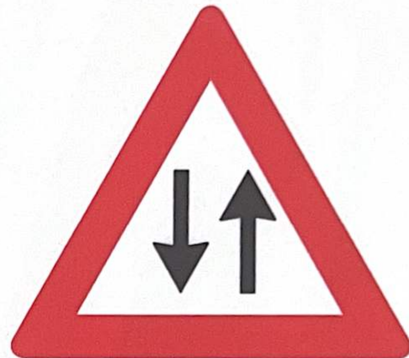
CIRCULATION À DOUBLE SENS